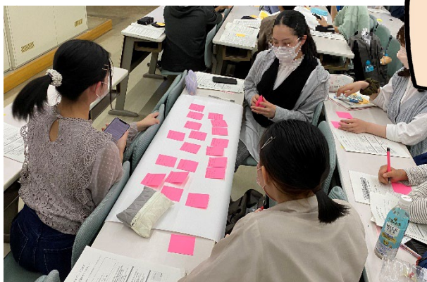
2022年度総代会の様子、グループワークで生協への様々な意見を出し合いました