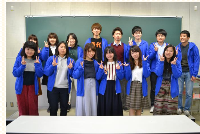
生協学生委員会とんがり

当日は「 青いパーカー 」を着た者が 説明させていただきます。 生協学生委員会一同、一生懸命準備して お待ちしておりますので ぜひ保護者の方も新入生とともにご参加ください