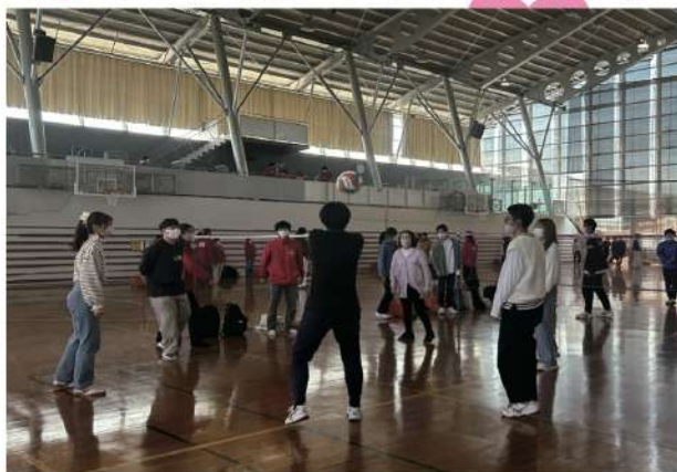
去年の一次会の様子