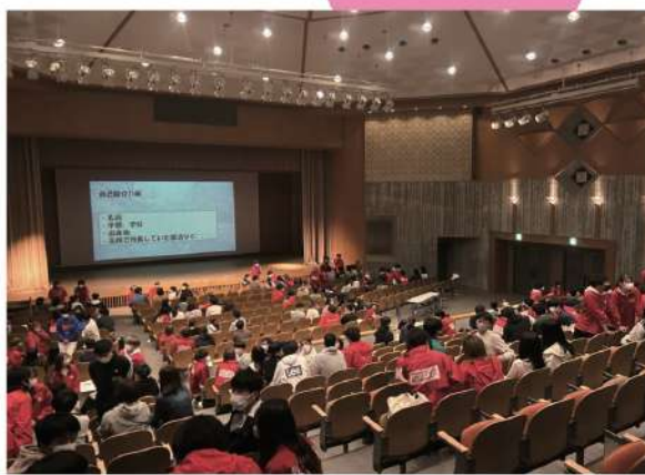
去年の二次会の様子